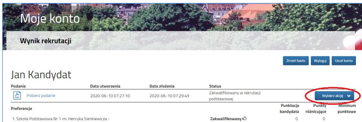
Rysunek nr 1

Po ogłoszeniu wyników kwalifikacji rodzice/opiekunowie dzieci zakwalifikowanych będą mogli złożyć potwierdzenie woli przyjęcia elektronicznie - dotyczy tylko wniosków. W tym celu należy zalogować się na konto, następnie przy wniosku dziecka zakwalifikowanego kliknąć przycisk Wybierz akcję (Rysunek nr 1).