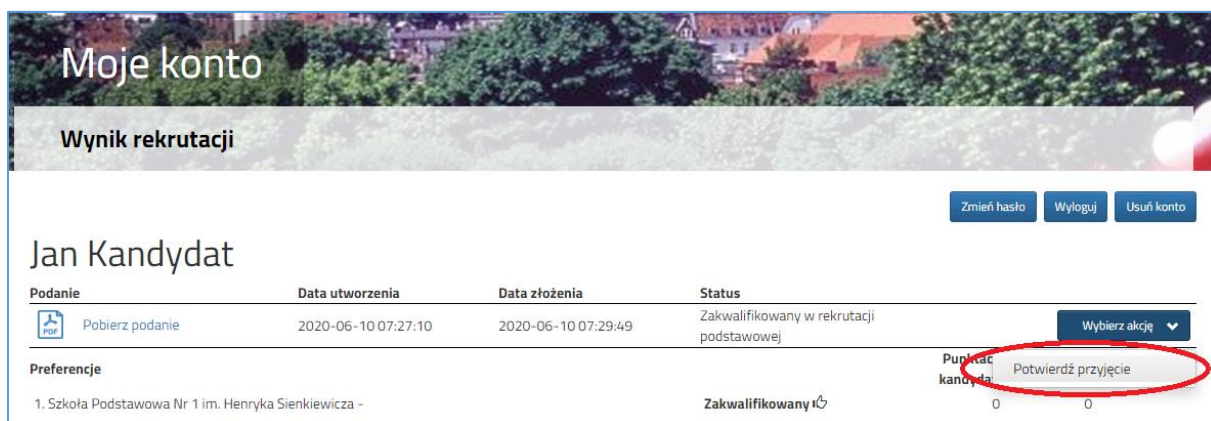
Rysunek nr 2

W kolejnym kroku należy wybrać opcję Potwierdź przyjęcie (Rysunek nr 2).